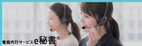
電話代行サービス e秘書®